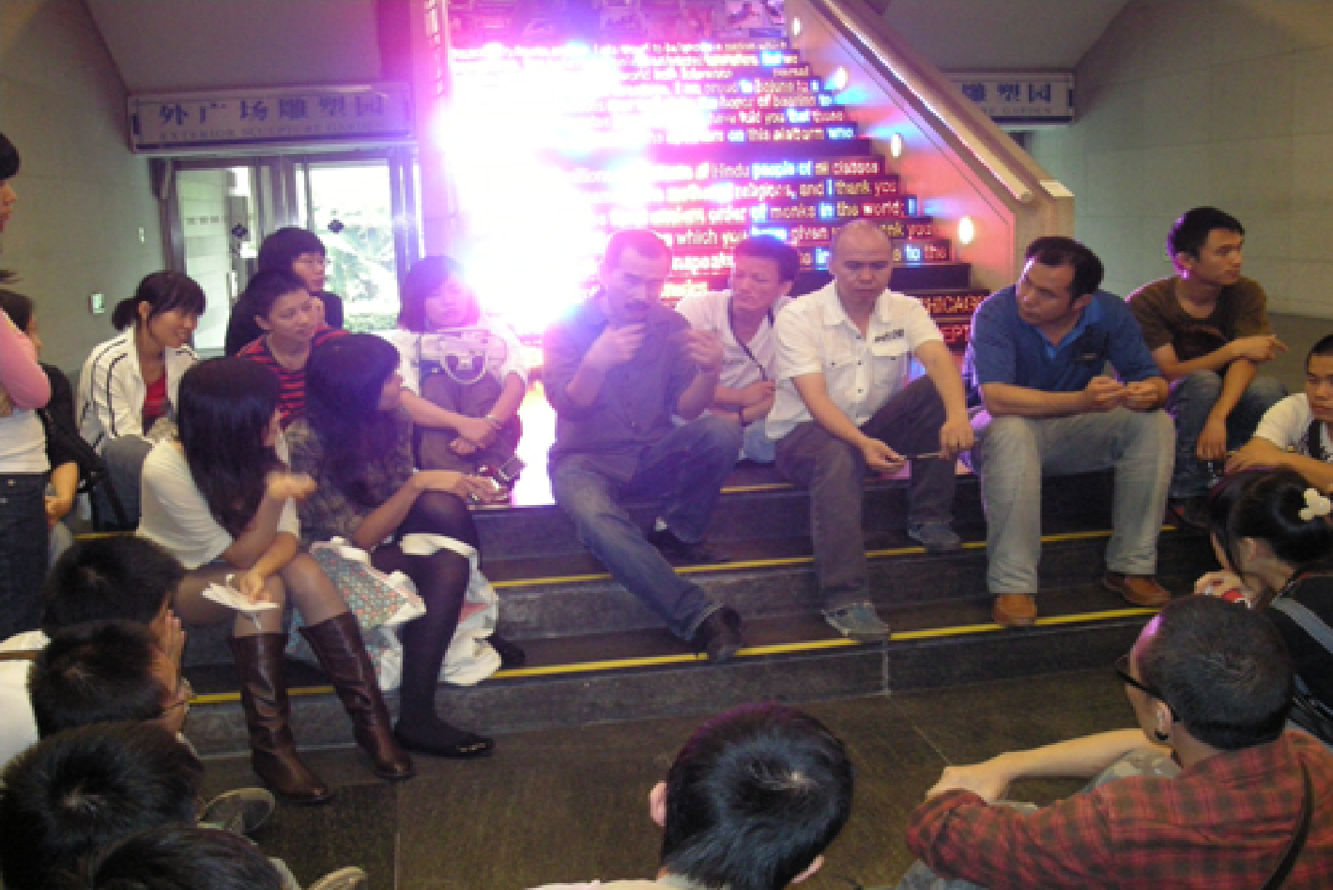
美术馆课堂“观念”专场