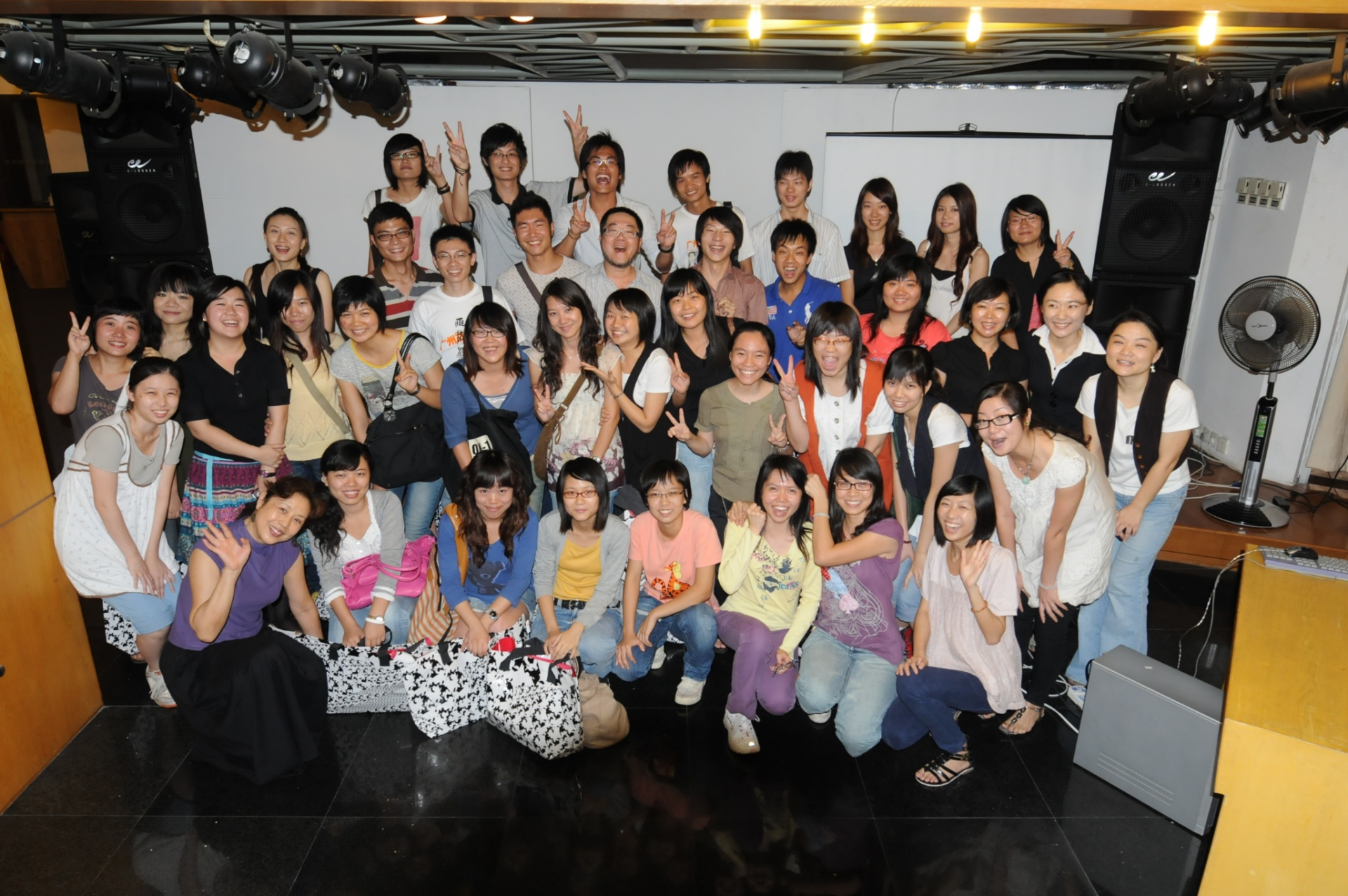
三年展志愿者团队交流会后合影