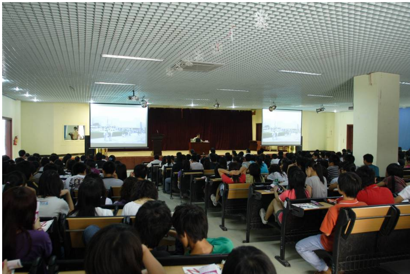
技术师范学院三年展推广讲座海报与现场