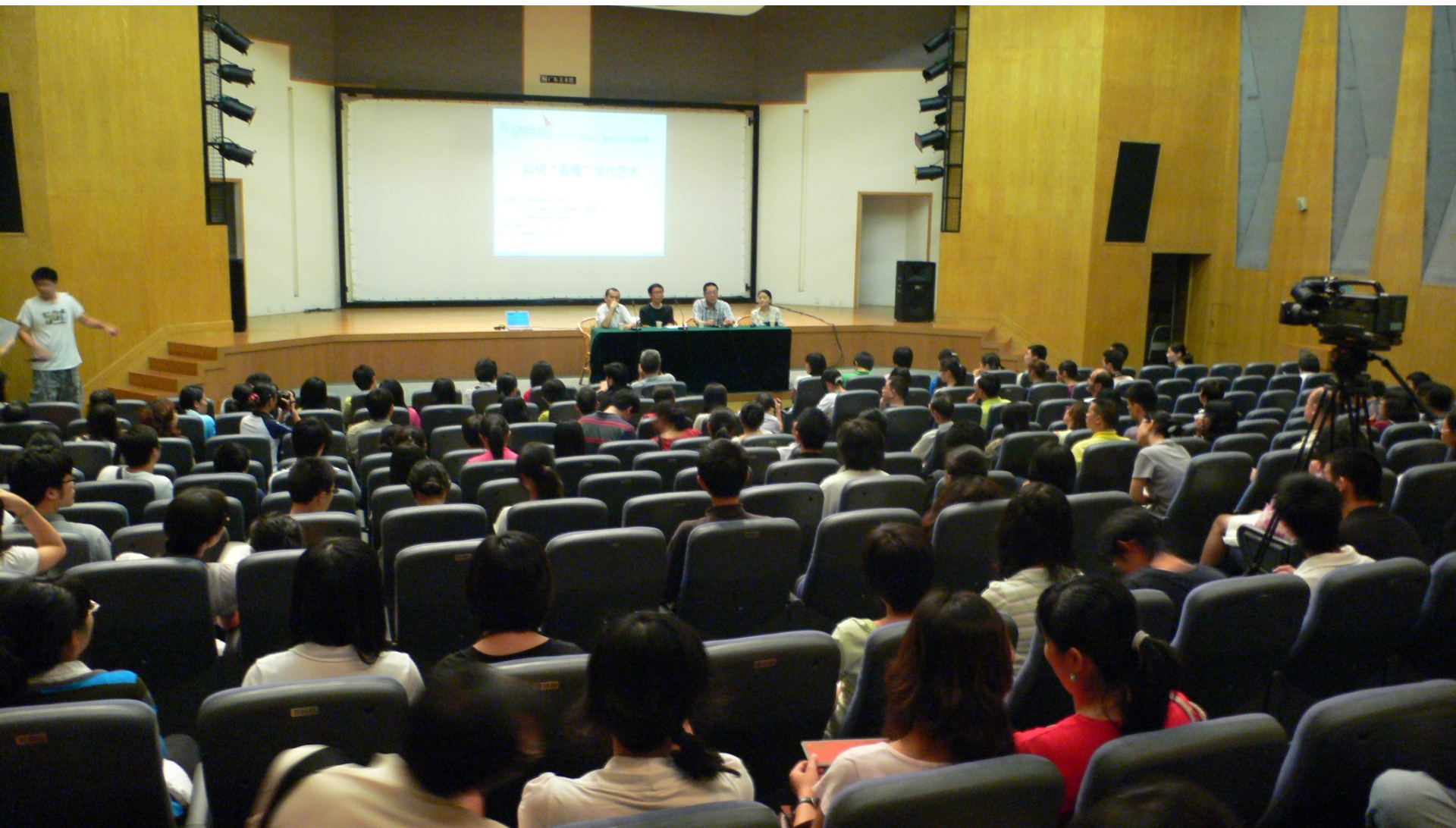
“十万个为什么”答观众问讲座现场