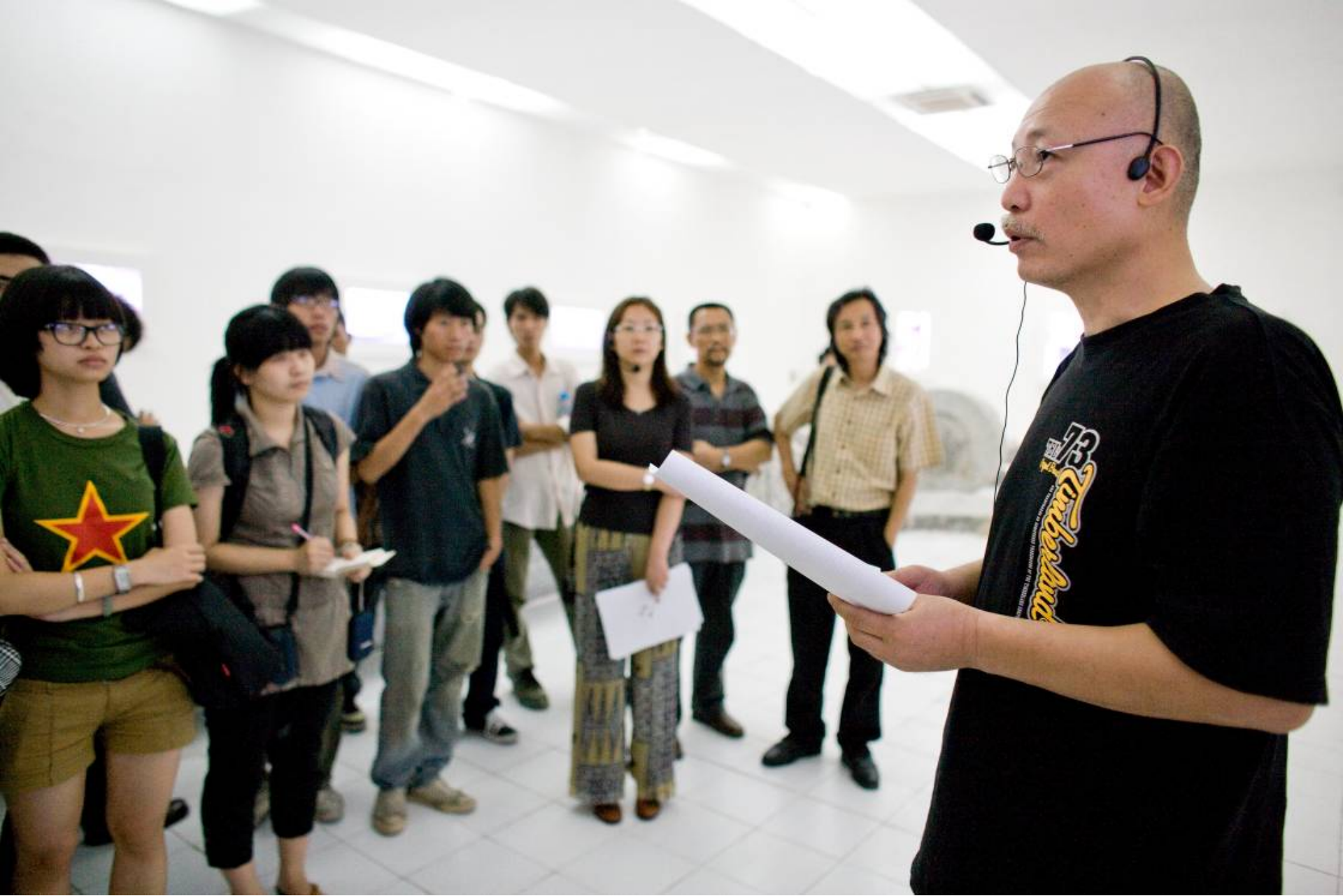
美术馆课堂广州美院教育系“影像”专场