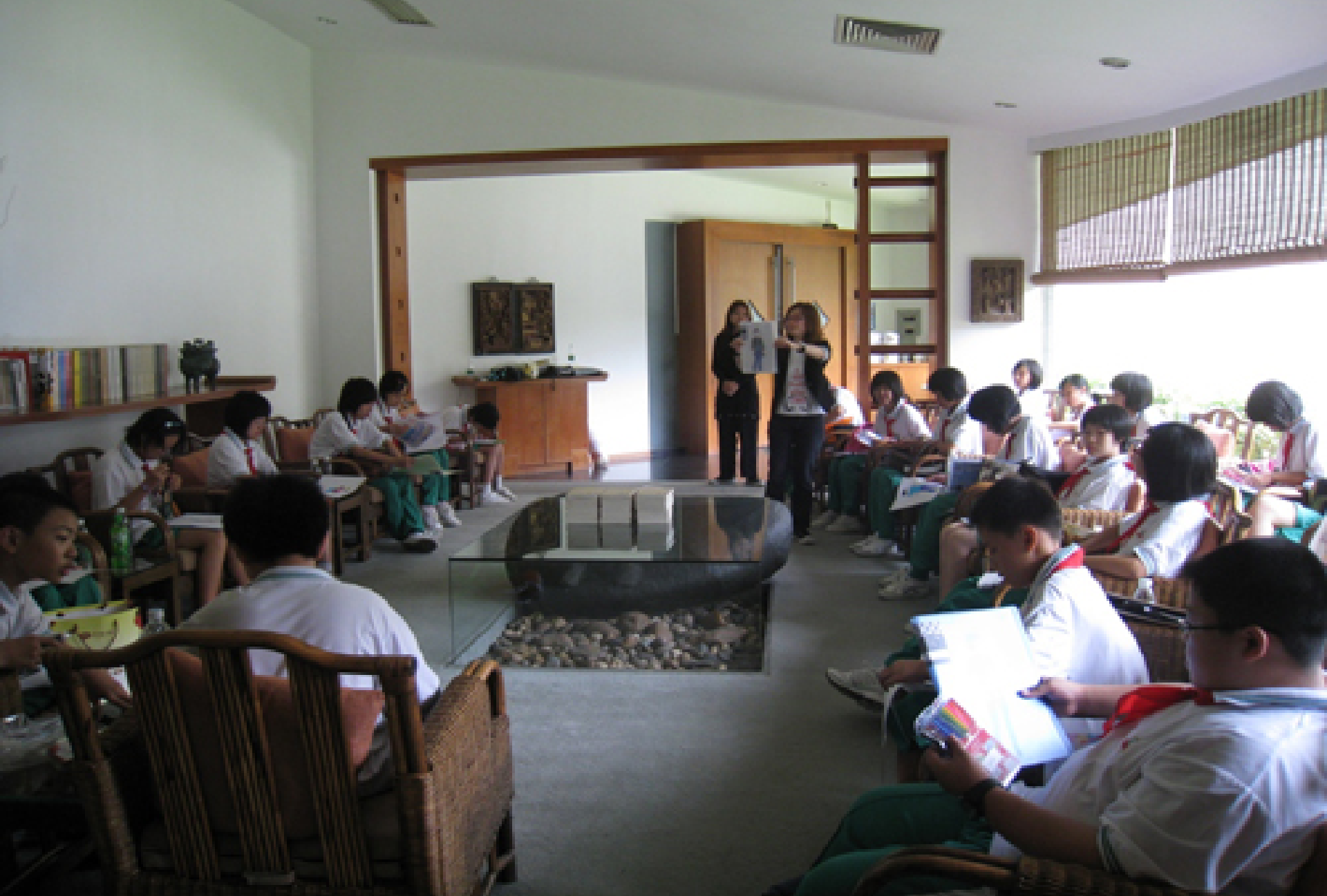
太古汇青年学生艺术工作坊