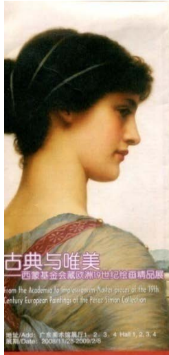
古典与唯美 西蒙基金会藏欧洲19世纪精品展 From the Academia Impressioniste Pele pieces of the 19th Century European Family of the Year 1900 Collection 地址: Add: 广东美术馆展览厅 1-2, 3, 4 Hall 1, 2, 3, 4 电话: China: 20081123-2009128